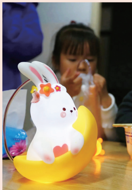
福利院孩子收到兔子灯

上海市儿童福利院、上海市儿童临时看护中心等40多个机构的5000多名孩子也收到了兔子灯，它们来自复星42个成员企业