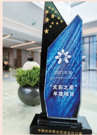
“光彩之星”年度项目奖杯

业基金会、中国人口福利基金会发起了乡村医生项目，通过“五个一”工程，从基础保障、能力提升、大病患者救助、暖心村医案例推选、智慧卫生室升级等角度全方位守护乡村医生。截至今年，共计派出314位