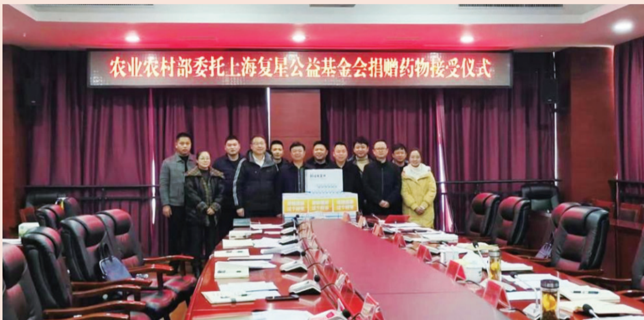
农业农村部委托捐赠仪式

1月30日，复星基金会、真实生物联合农业农村部向贵州南明、剑河、台江、玉屏，湖北咸丰、来凤，湖南龙山、永顺，广东连南9区县捐赠的阿兹夫定悉数运抵。这批物资将通过乡村医生项目点对点、包人包户形式，保障基层孤寡老人等特殊困难群体基本健康。本次捐赠是复星阿兹夫定捐赠专项战役第一阶段的收尾之战。从1月9日到1月30日，复星基金会已向中西部19省116个县捐赠173200瓶阿兹夫定，守护超过15万农村老人，助力乡村平稳度疫。