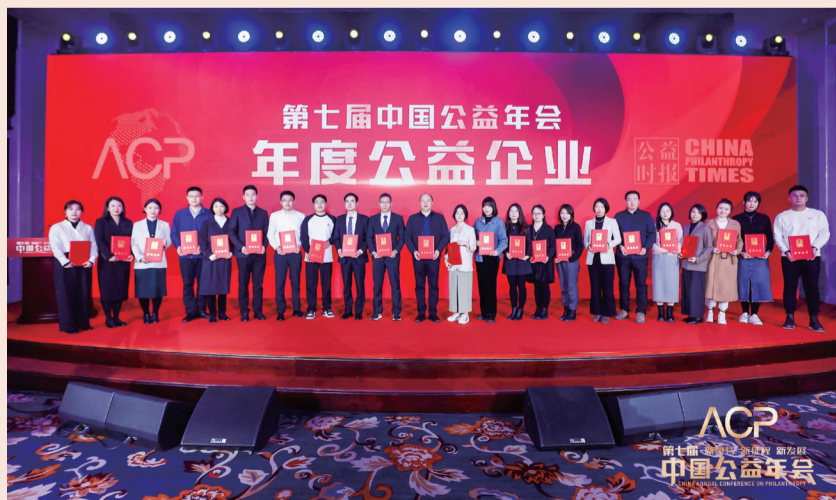
中国公益年会颁奖典礼现场

截至2月17日，复星基金会和舍得共捐赠价值74万余元的物资，包括4辆救护车、10台制氧机、57双户外运动鞋（用于走访基层）、2016套给到基层护肤的户外护肤用品。石棉基层医务人员表示，此次捐赠可谓“雪中送炭”。救护车在运送偏远山区的危重病人方面发挥着关键作用，制氧机将缓解救治心脑血管、呼吸系统疾病病人的硬件短缺状况，满足石棉县公共卫生设施重建需求，从而极大增强了石棉人民重建美好生活的信心和勇气。