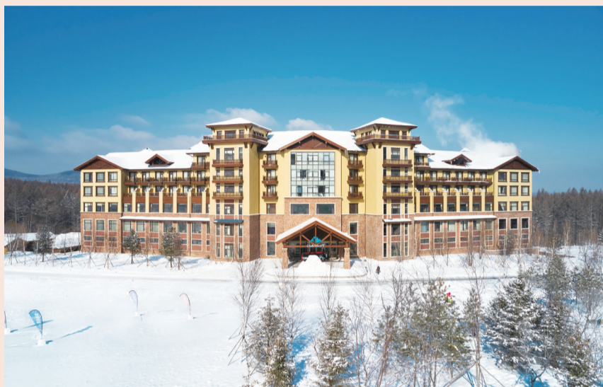
长白山 Club Med 地中海俱乐部

总的来说，2022年底至2023年初这一雪季折射出三大趋势。第一，随着冰雪运动的普及，“北雪南移”现象开始出现；第二，一次性体验滑雪占比下降，更多消费者会反复消费，显示出对滑雪运动增强的黏性，说明我国冰雪产业正日益成熟；第三，随着技术的迭代升级及消费者对冰雪娱乐消费需求