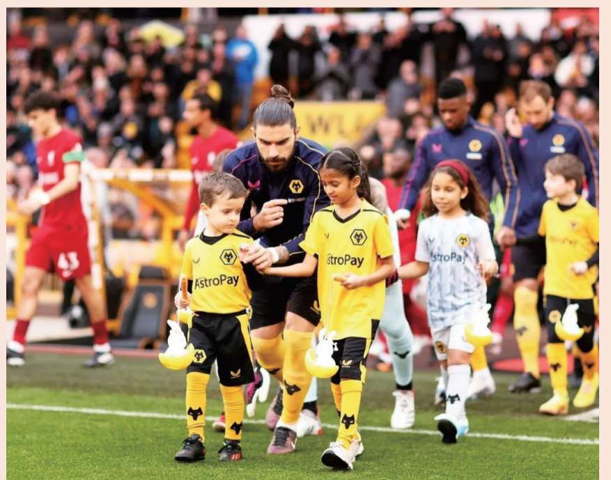
11名球童提着兔子灯与球员牵手进球场