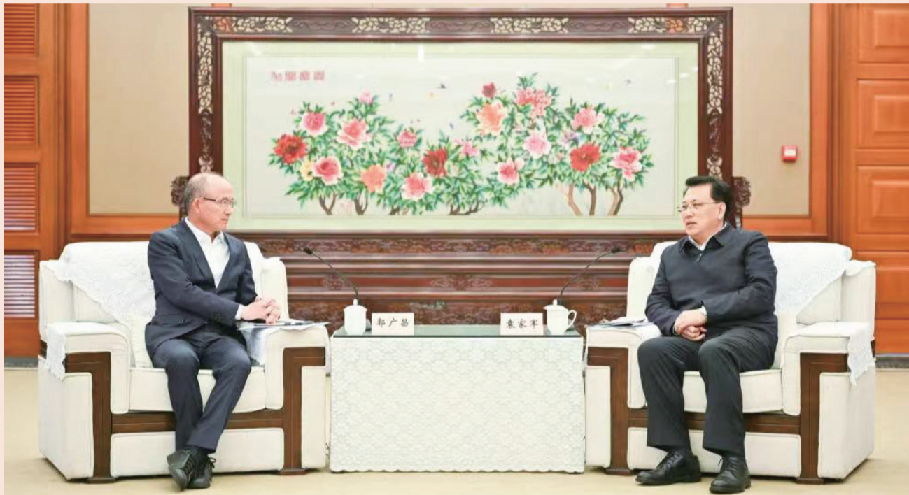
2月23日下午，重庆市委书记袁家军会见复星国际董事长郭广昌一行。

郭广昌感谢重庆对复星国际在渝发展的大力支持，介绍了企业发展、在渝项目和下一步合作等情况。他说，重庆营商环境优越，市委、市政府一心一意谋发展，党员干部干事创业的劲头很足，特别是服务企业、服务项目的意愿强烈。复星对重庆未来发展充满信心。