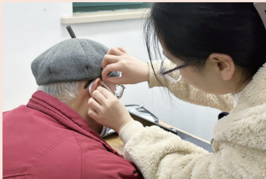
捐赠助听器有利于缓解老人听力障碍及预防心理疾病

2月14日，复星基金会携手唯听助听器（上海）有限公司（以下简称“唯听”）、复星医药及河南真实生物、上海蜂邻健康养老服务中心（以下简称“蜂邻”），在上海小东门街道综合为老服务中心分中心举办“听见星声、用爱传递”助听器及药品捐赠