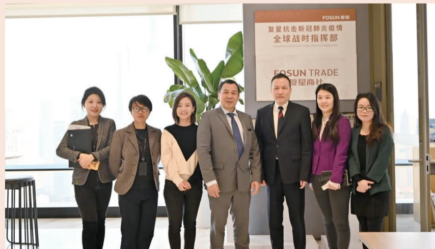
联合国难民署驻华代表卢沛赫（左四）一行访问复星

卢沛赫称赞了复星在助力抗击新冠疫情方面取得的成果，并表示复星在中国与全球拥有强大的商业网络，期待复星能成为联合国难民署的合作伙伴，在全球应急驰援供应链整合方面有更深入的合作。