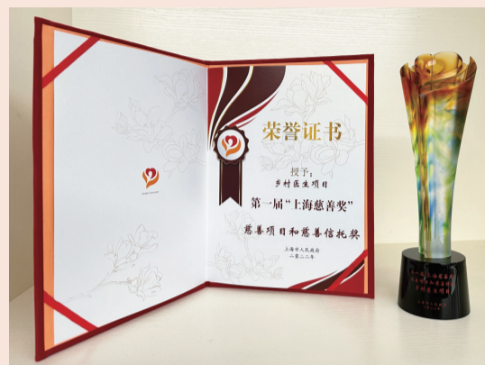
首届“上海慈善奖”奖状和奖杯

2月17日，首届“上海慈善奖”举行颁奖仪式，上海复星公益基金会（下称“复星基金会”）乡村医生项目获颁“慈善项目和慈善信托奖”。