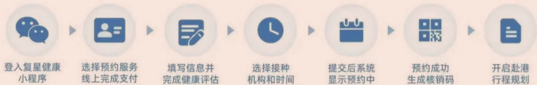
香港接种疫苗分布点

旺、湾仔各区近百个网点，专业医生客服团队提供接种须知和常见问题答疑，都倍增复星健康预约接种服务的权威性。