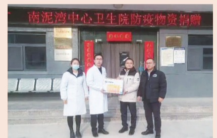
延安市宝塔区南泥湾镇马坊村卫生院获赠

2月9日，复星基金会联合复星医药、真实生物与华润慈善基金会向16座华润希望小镇，江西省广昌县、宁夏回族自治区海原县、福建省清流县三个华润集团定点帮扶和对口支援县共捐赠12400瓶阿兹夫定。