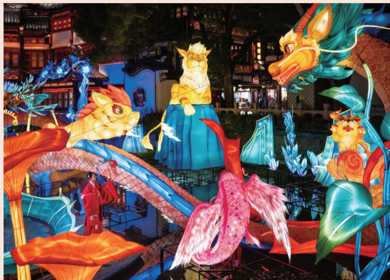
骑吾垂钓、当康突进、文鳐夜飞、陆吾摆尾