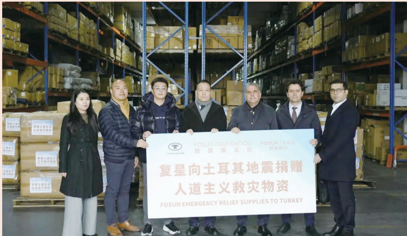
复星基金会联合豫园股份生态企业 Tom Tailor 及复星商社向土耳其灾区捐赠救灾物资