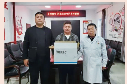
阿兹夫定运抵阿尔山华润希望小镇

这是复星基金会1月9日联合复星医药、真实生物发起的“乡村暖冬计划”落地的一部分。“乡村暖冬计划”宣布向中西部180县捐赠价值1亿元人民币的新冠口服药阿兹夫定，并联合多位院士倡议，多位院长、专家向基层直播防疫课。截至2月8日，已捐赠阿兹夫定255400瓶，爱心包427.5万元，物资发放到26个省的210个市或县。目前，药品捐赠正去往三线以下城市及乡村养老机构、福利院的老人。