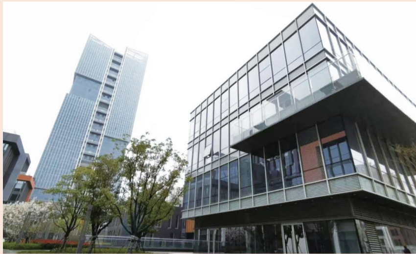
复星蜂巢项目合肥云谷金融城

围绕“产地房”，实现深度产业运营+产业投资，是复星蜂巢核心战略。复星蜂巢精选城市、在合适区域落地项目，因城施