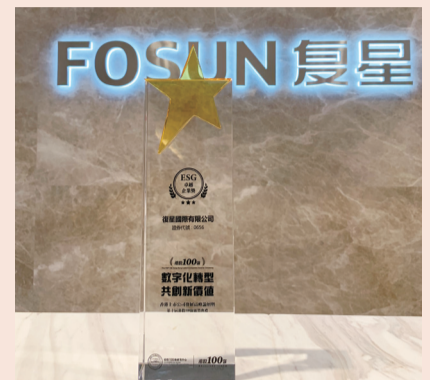
复星国际“ESG 卓越企业奖”奖杯

2月24日，港股100强研究中心主办、财华社等协办的“2022香港上市公司发展高峰论坛暨第十届港股100强颁奖典礼”在港岛香格里拉大酒店举行。复星国际获颁“ESG卓越企业奖”。同获此奖的还有大型蓝筹上市企业如香港铁路、中电控股、港灯、香港中华煤气、新世界发展等。