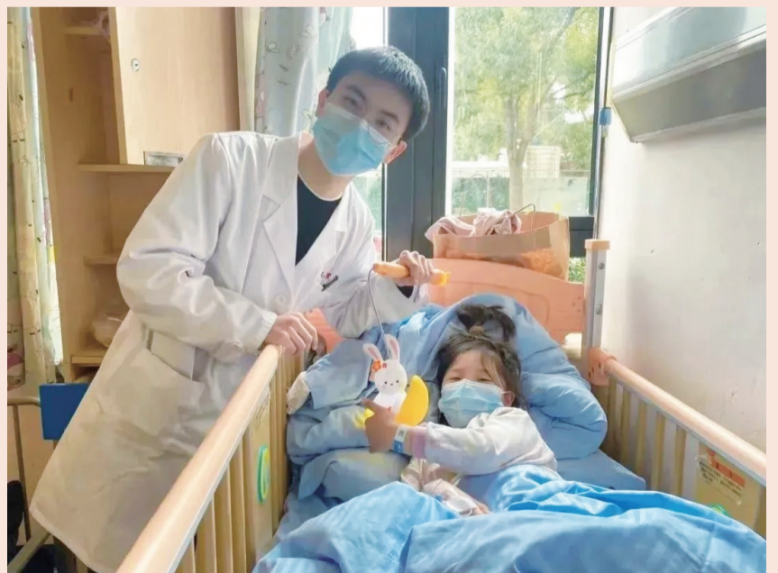
复旦附属儿科医院孩子收到兔子灯

数百名员工在20个小时内的筹集。2月3日在复星基金会给位于崇明的上海市第二社会福利院捐赠防疫物资时，灯会同事给孩子