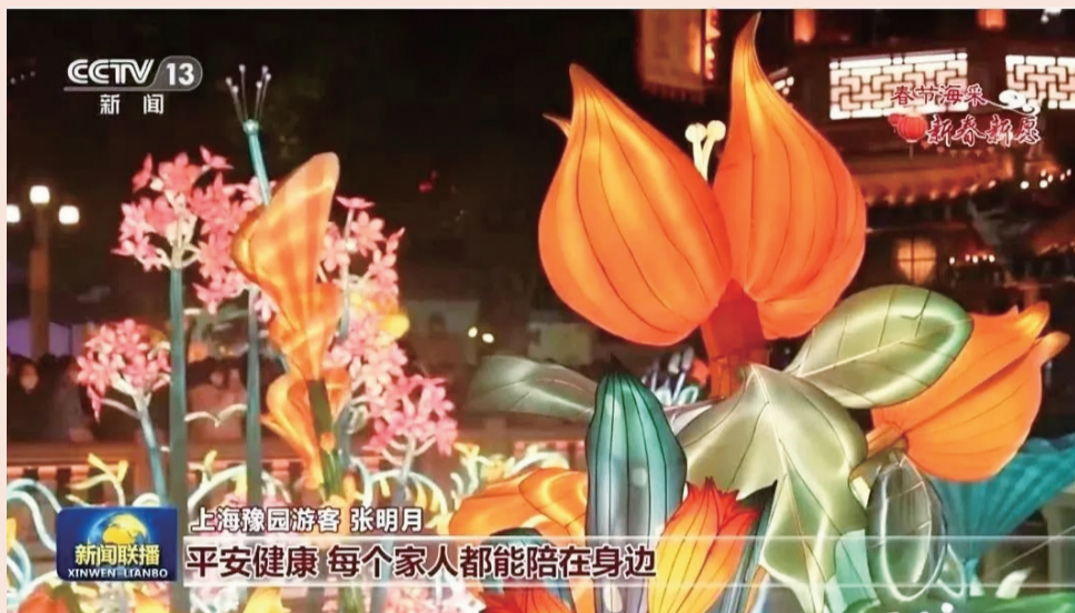
央视新闻联播报道上海豫园灯会

2月15日，癸卯豫园灯会最后一晚，游客按时走下九曲桥，在工作人员引导下有序出园。灯光装置准时熄灭。自2022年12月26日亮灯至2023年2月15日落幕，52天山海奇豫之旅，吸引超400万人次前来观灯，不仅聚拢久违的烟火气，助力经济回暖；更“出圈”、“出海”，将中国传统文化向世界传递。璀璨灯火有它们的点灯人、赏灯人和守灯人，台前幕后，故事一体。